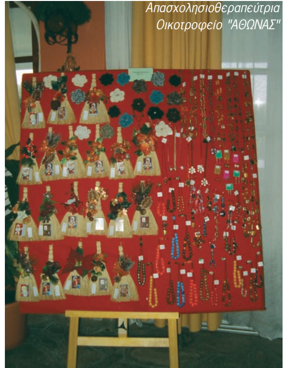
Ημερολόγια, κομπολόγια, μπρελόκ και κοσμήματα.

Χειροποίητα κεριά από φυσικό κερί (κερήθρα), προσφορά εθελόντριες